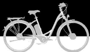
cadre VILLE tailles XS / S / M / L