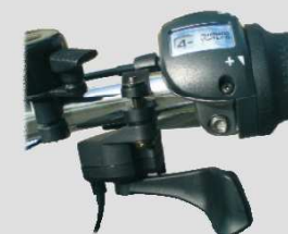
dispositif d'aide au démarrage sans pédalage jusqu'à 6 km/h (versions premium uniquement)