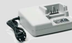
chargeur de batterie