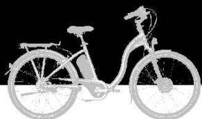
cadre VILLE tailles XS / S / M / L